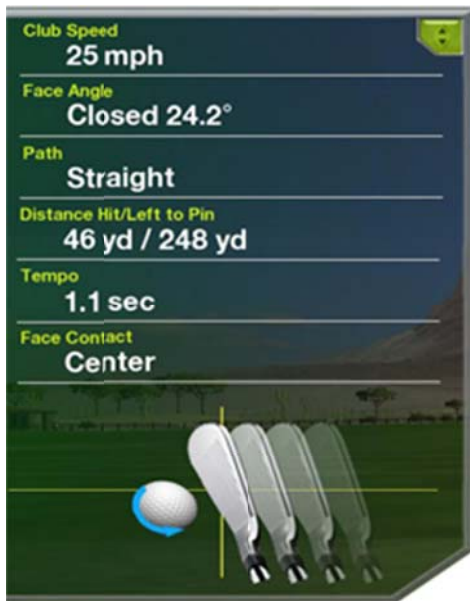
Zavřená (closed) úderová plocha hole